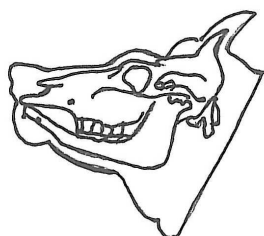
(obr. č. 3)